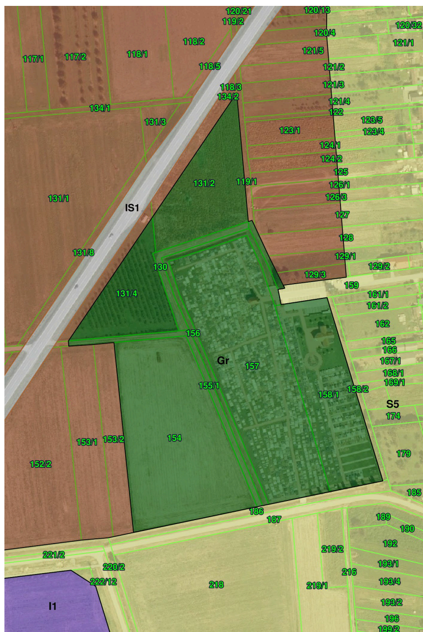
Grafički prikaz broj 2. Groblje